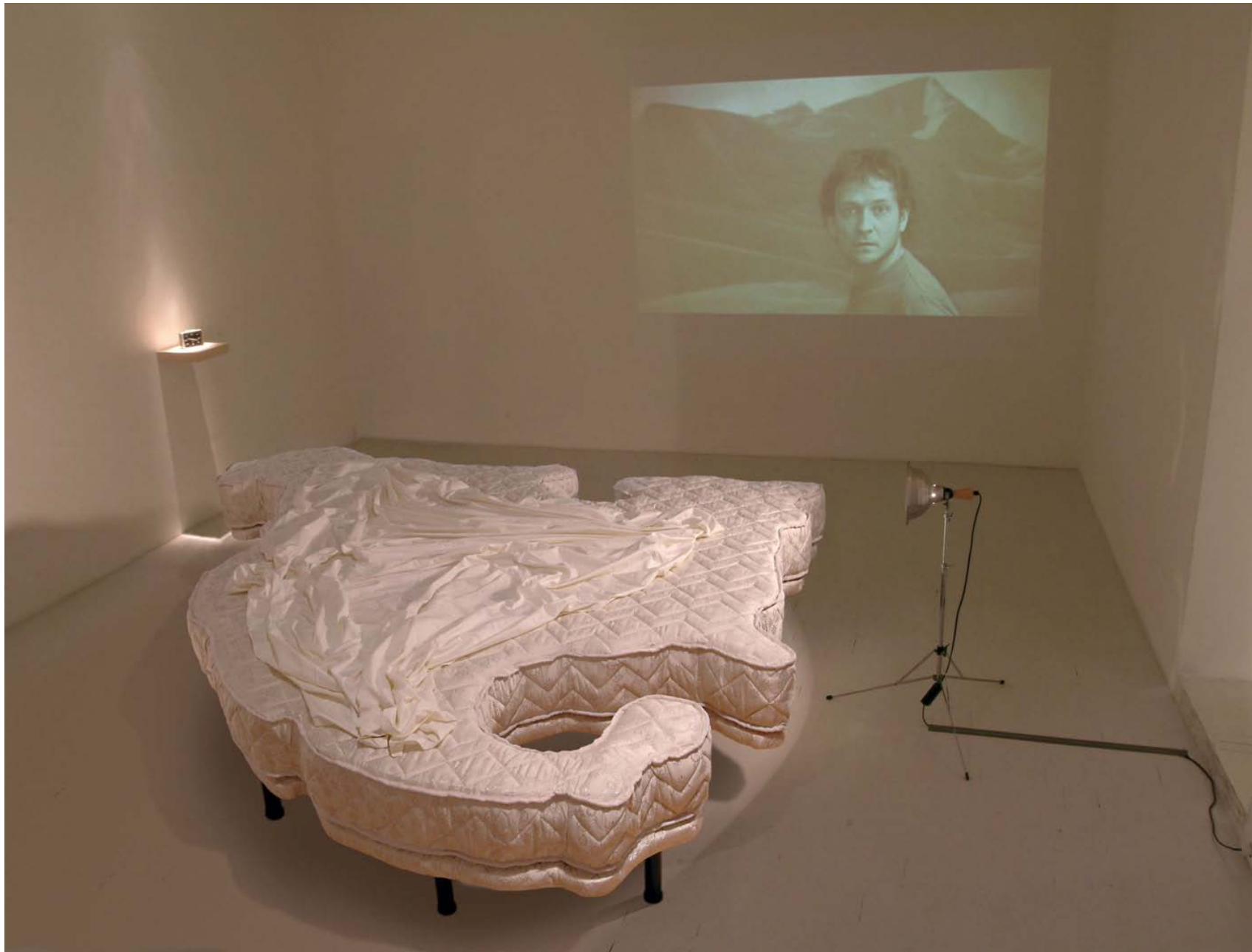
DESUBICADO (Cama América) 2003. Instalación PS1 Nueva York Medidas variables